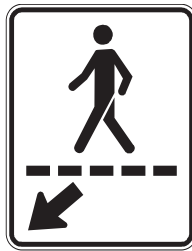
Passage pour piétons