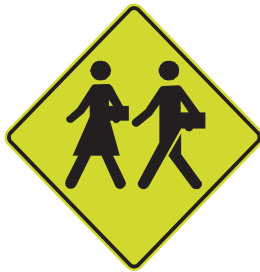
Indique à l'avance, la proximité d'une zone scolaire ou d'un passage pour écoliers