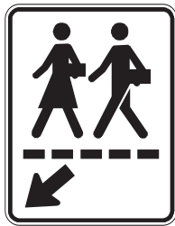
Passage pour écoliers