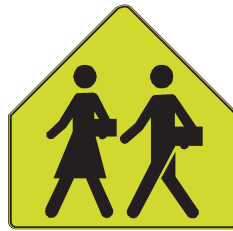
Début d'une zone scolaire