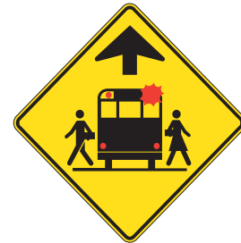
Signal avancé d'arrêt d'autobus scolaire