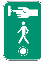
Obligation d'appuyer sur le bouton pour commander le feu de piétons