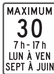
Limite de vitesse permise dans une zone scolaire