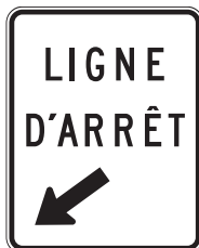
Endroit où les véhicules doivent s'immobiliser à l'intersection