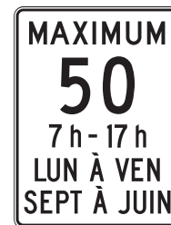
Limite de vitesse permise dans une zone scolaire