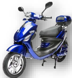
Gio Italia MK Premium 48 Volts