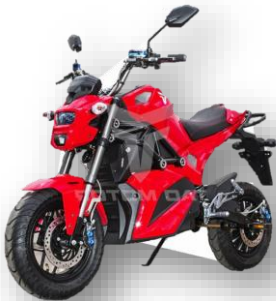
Tao Gemini 725: Tao Motors, Gemini 725 Moto Électrique, 72 Volts, 2 Places