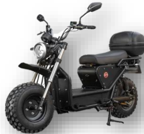
Daymak Beast 2: Daymak, Beast 2, Scooter Électrique 60 Volts, 500 Watts, 2 Places